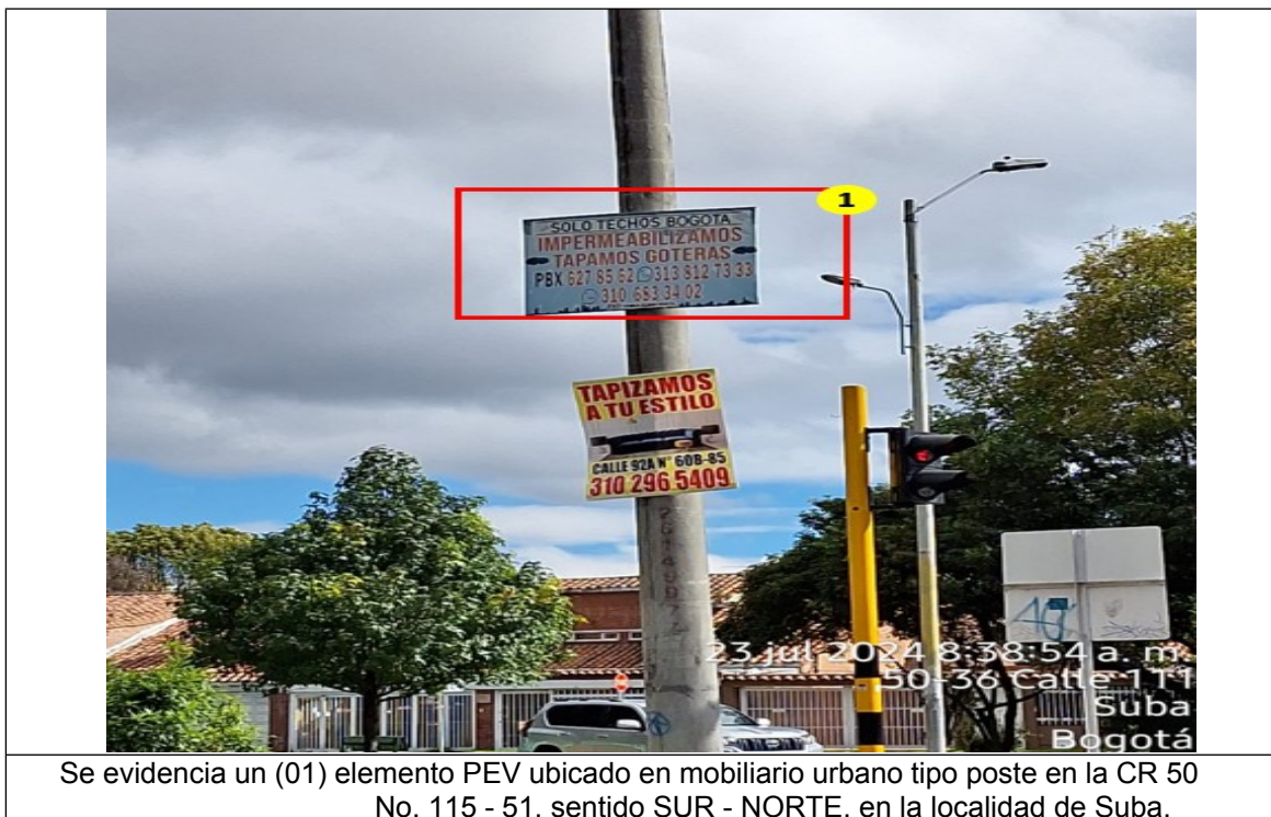
Se evidencia un (01) elemento PEV ubicado en mobiliario urbano tipo poste en la CR 50 No. 115 - 51, sentido SUR - NORTE, en la localidad de Suba.